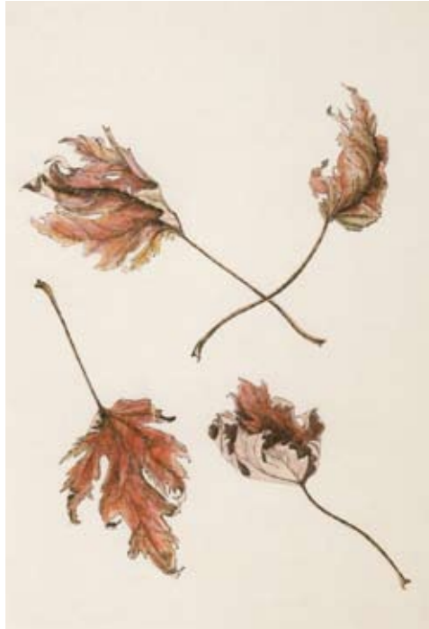
Zeichnungen nach der Natur sind vorbereitende Arbeiten für Schnitzereien.

die vielbeachtete Skulptur „Narziss“, ebenfalls aus Bronze. Anfang der siebziger Jahre übernimmt sie die sakral-künstlerische Ausgestaltung der Kirche Sankt Engelbert in Köln-Riehl in Marmor, Elfenbein, Ebenholz und Gold.