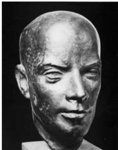
Porträt des Architekten Professor Rudolf Schwarz, 1947