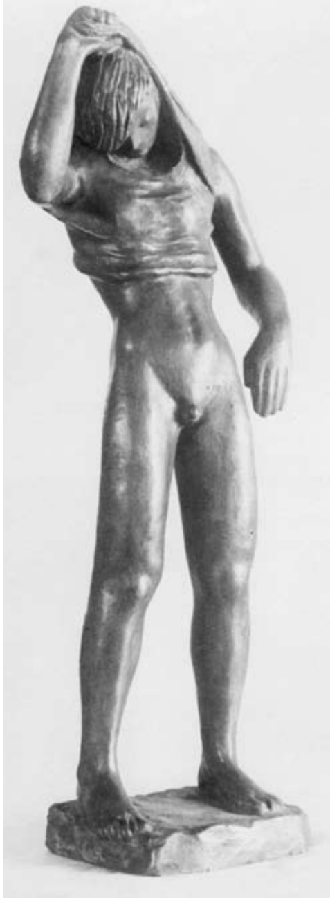
Der „Hemdauszieher“ in Bronze, 1947

fangen mit all dem gequälten Deutschtum – ich liebe unkomplizierte dicke Frauen – und starke Männer, bei denen man sich ausruhen kann.“ Im Moment möchte sie für einen Renoir alle Plastiken Ernst Barlachs eintauschen. Dazu muss man wissen, dass Marcks zu der Zeit die Arbeit an einer Reihe von großen Figuren für die Katharinen-Kirche in Lübeck fortsetzt, die der verstorbene Barlach begonnen hatte. Zwei Nachformungen davon befinden sich über dem Portal des Kunsthouses Lempertz an der Cäcilienstraße (s. BlickPunkt 12). 1950 dann folgt Gerhard Marcks den wiederholten Einladungen der Freundin und bezieht ebenfalls ein Wohn- und Atelierhaus in ihrer Nachbarschaft. Sie pflegen engen Kontakt miteinander und porträtieren sich gegenseitig.