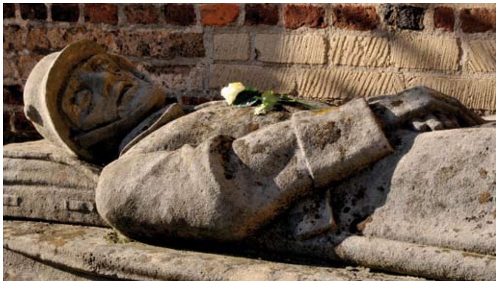
1925 fertigt Hildegard Domizlaff ein Kriegerdenkmal, das sich an der alten romanischen Kirche Sankt Martin im heutigen Köln-Esch befindet.

Soest, wohin sie Anfang 1922 übersiedelt, ist die Heimatstadt ihres Vaters. Dort fühlt sie sich unbeschwert und unabhängig. Die junge Bildhauerin lebt in einer Künstlerge-