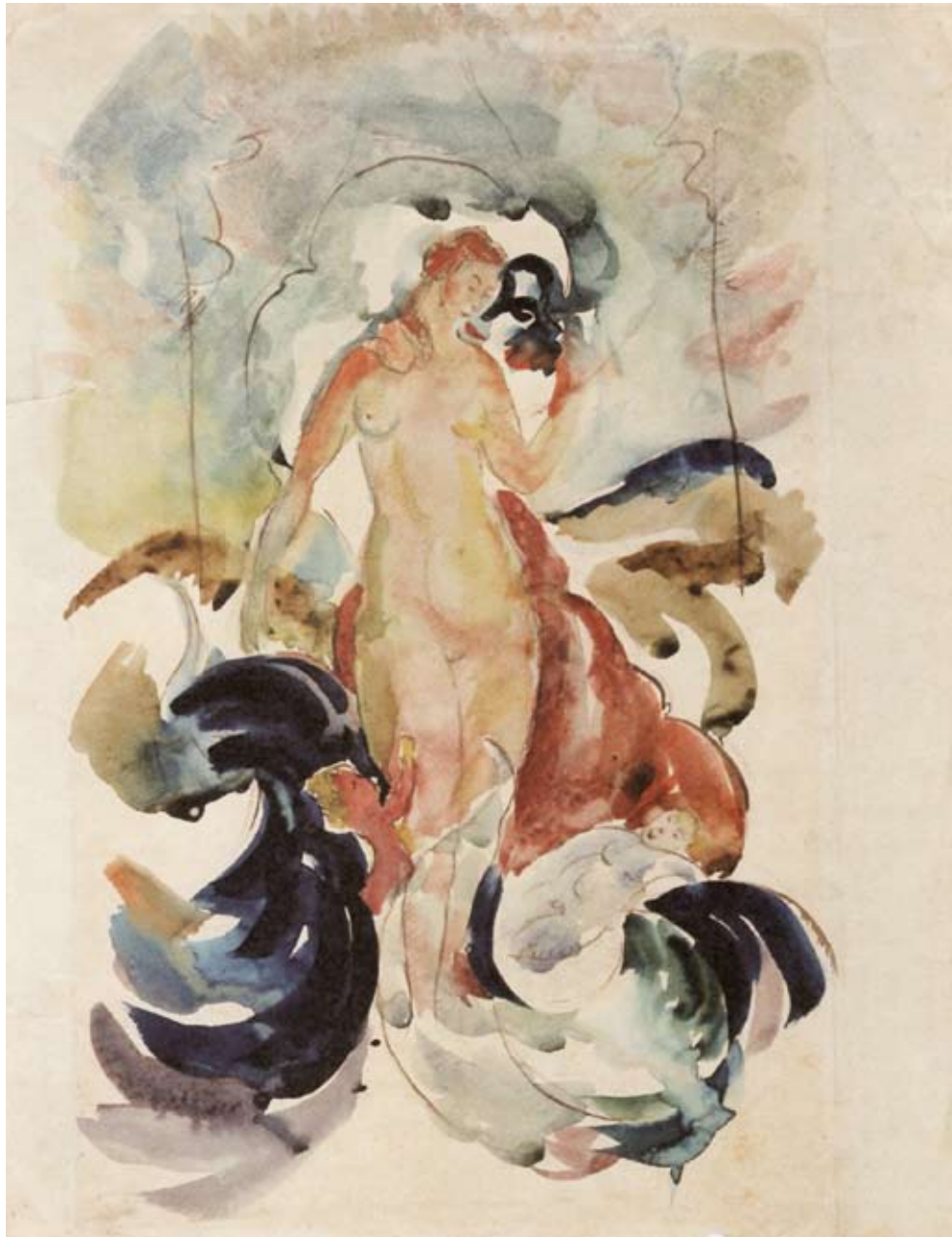
Venus mit zwei Knaben, 1921: Expressionismus, Dadaismus und Futurismus konkurrieren miteinander.