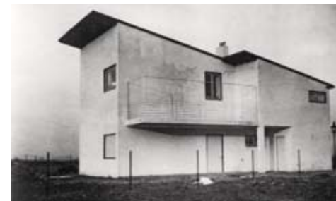
Wohn- und Atelierhaus im Stil des Neuen Bauens in Köln-Müngersdorf, Belvederestr. 79, 1930

1915 macht die Siebzehnjährige zunächst eine gärtnerische Ausbildung in Berlin. Schon davor hat sie gezeichnet, nun versucht sie sich im Modellieren und wird schon 1919 mit einer Porträtbüste in Leipzig ausgestellt. Der Schriftsteller Max Klinger rät der jetzt 20-Jährigen zu einer künstlerischen Ausbildung, und so darf sie 1918 als eine der ersten