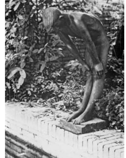
„Narziss“ in Bronze, 1954, stand ursprünglich in den Rheinwiesen.

Das Kreuz von hohem künstlerischem und ideellem Wert hat einen silbernen Korpus, die trapezförmigen Balken sind auf der Vorder- und Rückseite mit Silberblech beschlagen, während die äußeren Ränder mit getriebenen Lorbeerblättern verziert sind. Parallel zu den Balkenenden befinden sich Edelsteinfassungen. Auch die Rückseite ist gestaltet, während die Seitenansichten eine