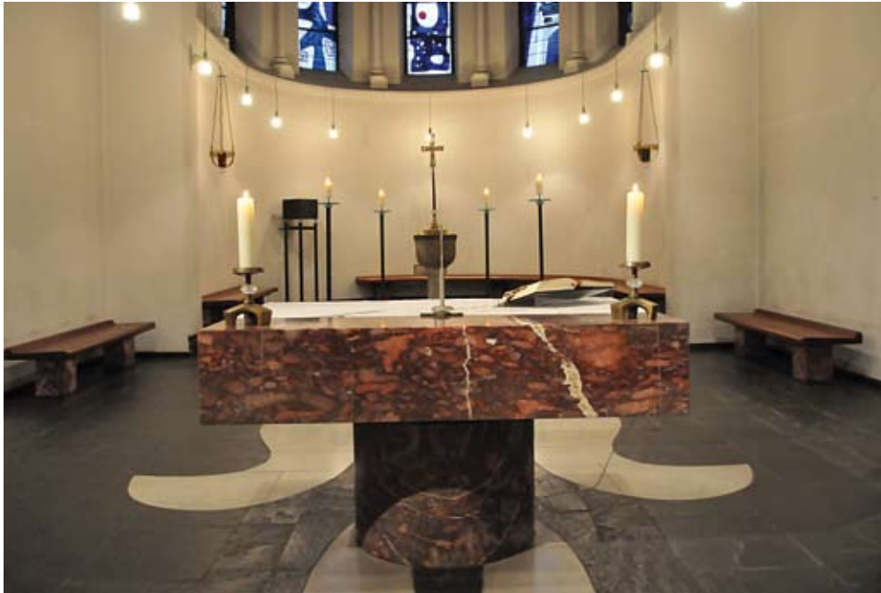
Chor der Kirche St. Vitalis, für den Domizlaff 1960 Tabernakel, vier Kerzenhalter und das Prozessionskreuz schuf.

leicht schon gehöre und in die, die in der Kirche zur Ruhe gekommene Seele jedenfalls gehört, nach der ich mich unbedingt sehne, von der ich jetzt glaube, daß sie eine Form für meine Kunst in Zukunft abgeben wird.“