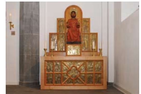
Detail des Herz-Jesu-Altars (links) der Kirche Sankt Cosmas und Damian in Köln-Weiler; oben Gesamtansicht